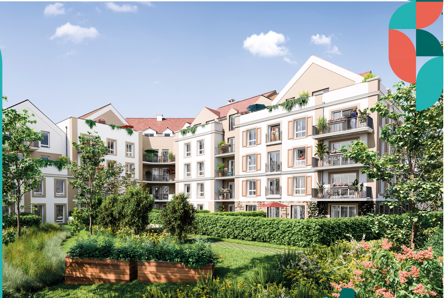
Illustration de la résidence "Préface", lot H de l'opération d'aménagement. © Eiffage Immobilier.